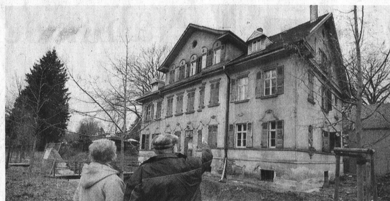
Hospizverein Oederan: Der Verein Hospiz- und Palliativdienst „Begleitende Hände“ bemüht sich seit 2006 darum, in Oederan im Landkreis Mittelsachsen, ein stationäres Hospiz einzurichten. Gemeinsam mit der Stadt Oederan wird jetzt eine ehemalige Fabrikantenvilla am Klein-Erzgebirge saniert und umgebaut. Bis Herbst 2011 sollen hier zehn Plätze für die Betreuung todkrank Menschen entstehen. Seit 2009 unterhält der Verein zudem einen ambulanten Hospizdienst.