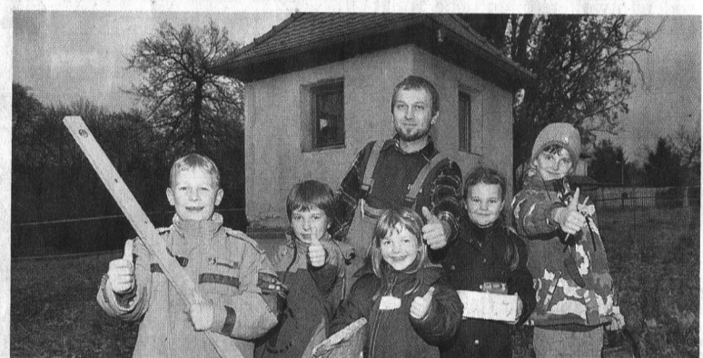
Kinder- und Jugendarbeit Oelsnitz: Der Verein in Oelsnitz im Vogtland engagiert sich auch in den kleineren Ortsteilen, wie zum Beispiel in Magwitz. Dort bauen Kinder und Jugendliche einen älteren Pavillon im Rittergut zu ihrem Treffpunkt aus – und zwar in Eigenarbeit. Der Fußboden liegt schon, die Tür ist ausgewechselt und die ersten Wände sind gestrichen. Aber noch ist einiges zu tun, so die Dachrinnen und der Außenputz. Zum Dorfjubiläum im nächsten Jahr soll der Pavillon fertig sein.