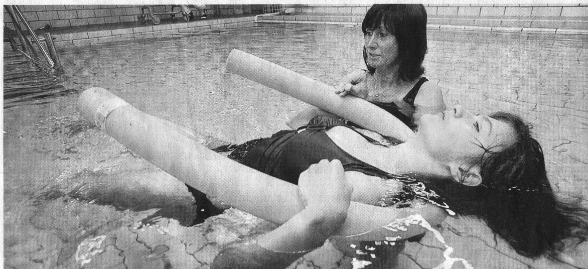
Körperbehindertenschule Chemnitz: Der Zustand der Schule für Körperbehinderte zählt zu den gravierenden Missständen in der Chemnitzer Bildungslandschaft. Der Verein „Leser helfen“ will mithelfen, dass sich die Bedingungen für die Schwimmtherapie der mehrfachbehinderten Kinder bald verbessern. Der Einbau eines Schwimmbeckens-Liftes, wie er heutzutage in den meisten vergleichbaren Einrichtungen bereits existiert, wäre für die Behinderten und die Therapeuten eine riesengroße Erleichterung.

Wenn Menschen in der Region in Not geraten oder Projekte Unterstützung brauchen, mit denen wiederum behinderten oder benachteiligten Menschen geholfen werden kann, dann bittet der Verein „Leser helfen“ die Leser der „Freien Presse“ um Spenden. Für die fünf aktuellen Projekte wurden bisher 16.400 Euro gesammelt. Allen Spendern an dieser Stelle ein herzliches Dankeschön!